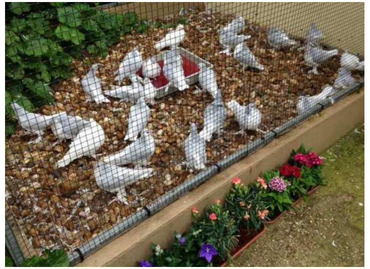
Les pigeons au bain