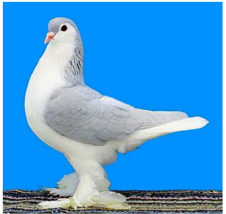
Mâle lavande 97 – Metz 2015