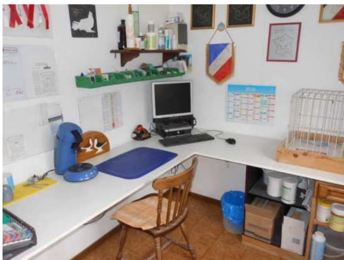
Le bureau dans la partie arrière du pigeonnier