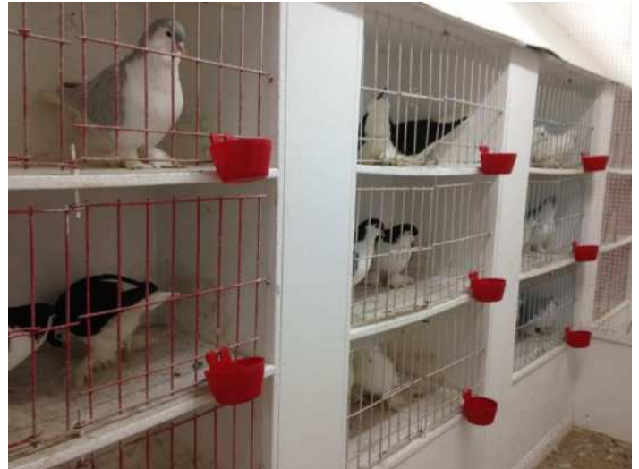
9 couples en préaccouplement par volière