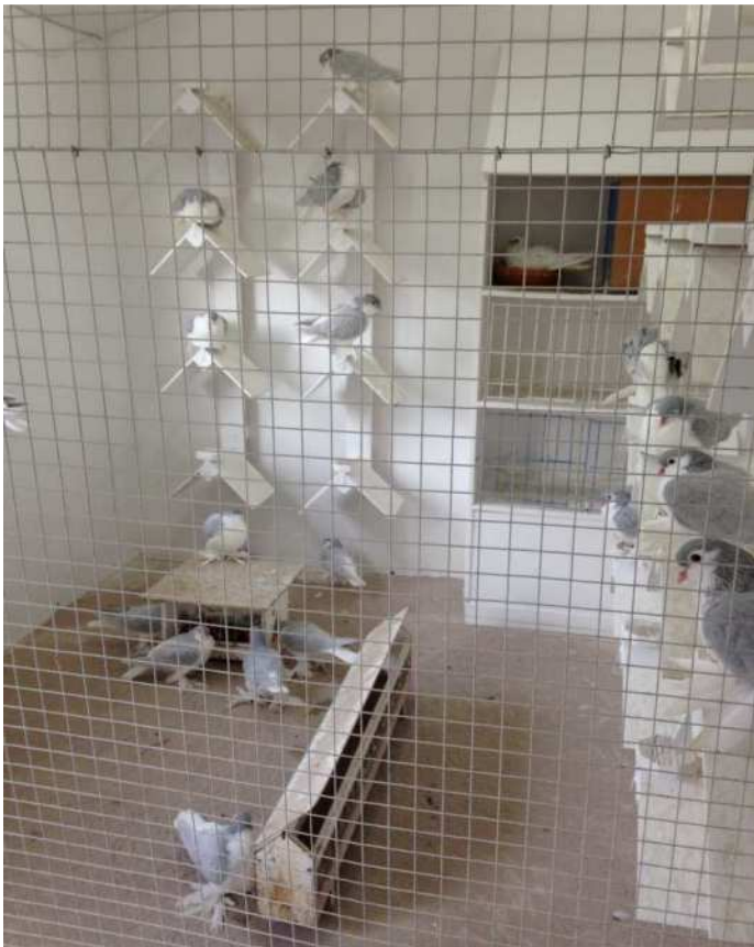
Volière des jeunes lavandes