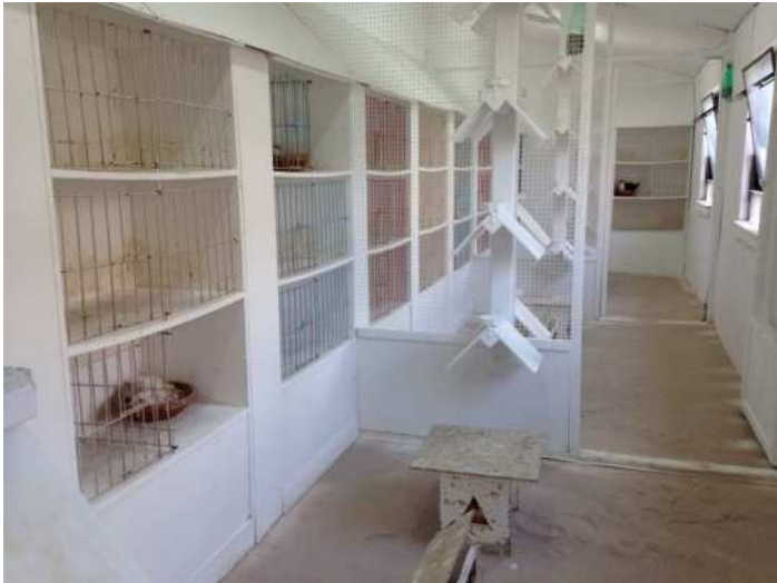
Les 3 volières de reproduction