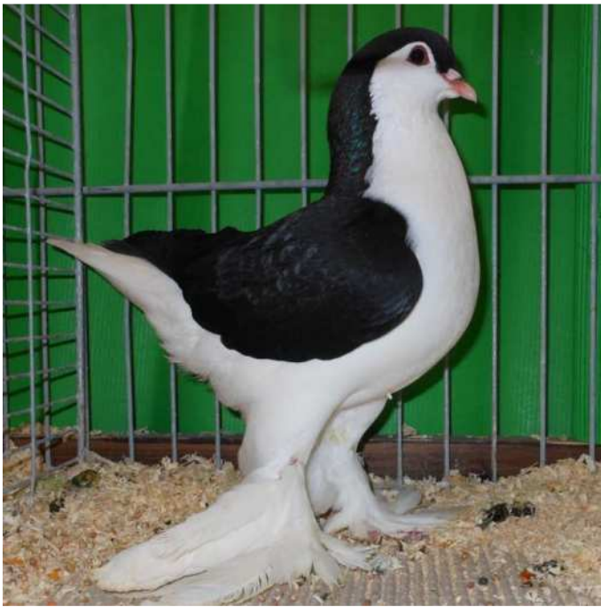
Femelle noir 97 – Périgueux 2017