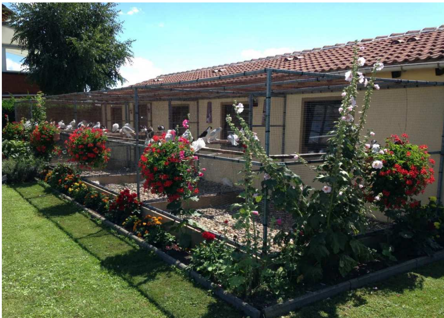
Vue extérieure du pigeonnier

Son élevage est constitué de trente couples de reproducteurs en Lahore noir, Lahore lavande et Frisés blancs à coquille.