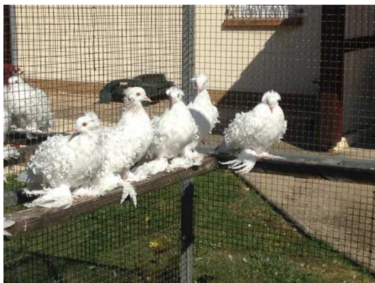
Frisé blanc à coquille