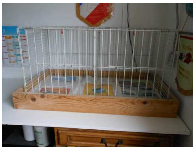
Le poste de toilette dans le bureau

Cette petite pièce chauffée en hiver sert d'infirmerie, de local de préparation aux expositions et suivi de reproduction, tout le matériel sanitaire y est entreposé pour les examens de fientes ou autres interventions sanitaires. Le suivi d'élevage est informatisé pour une meilleure fiabilité.