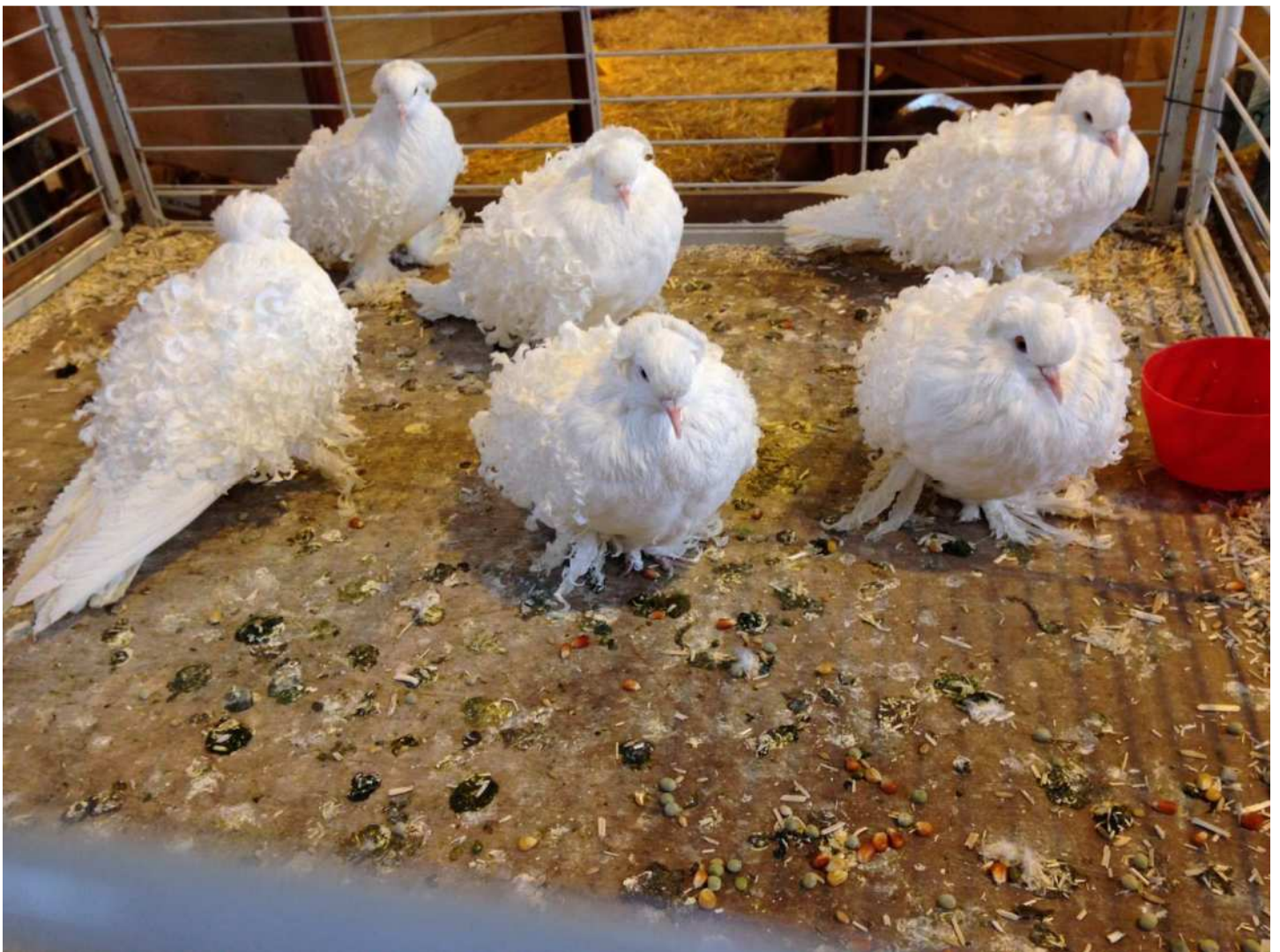
Volière Frisés blancs à coquille 97 – Championne à Périgueux 2017